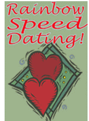
AIN Rainbow Speed Dating

po, asistencia y servicio a muchos. Todos los fondos que se recauden a través de Rainbow Speed Dating se destinarán a labores de educación y prevención a través de AIN. Para mayor información acerca del día, hora, lugar y costo checa nuestra sección de eventos en www.aidsinterfaithnetwork.org